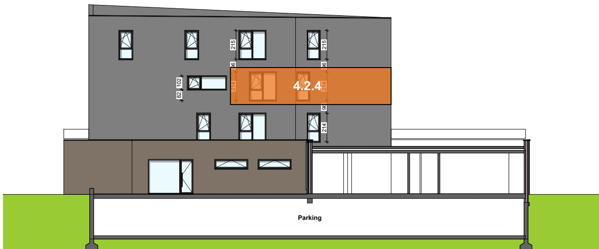
Façade arrière intérieure