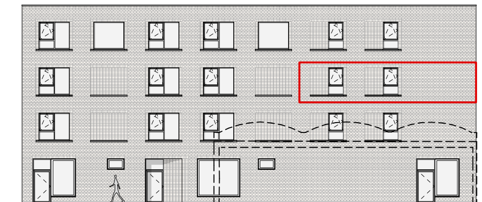
GEVEL - NOORD