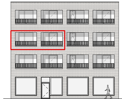
GEVEL - WEST