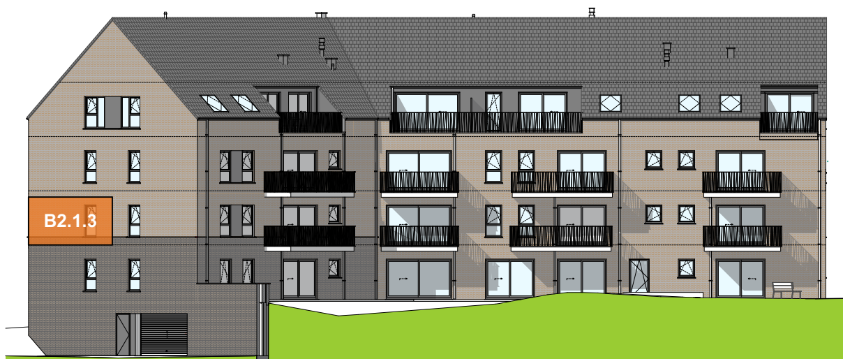
Façade arrière (Ouest)