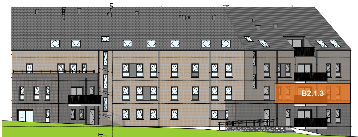
Façade avant (Est)