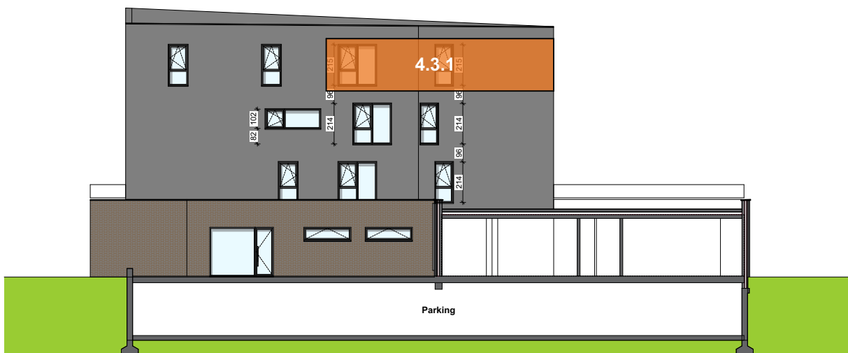
Façade arrière intérieure