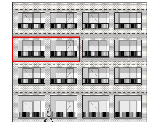
GEVEL - OOST