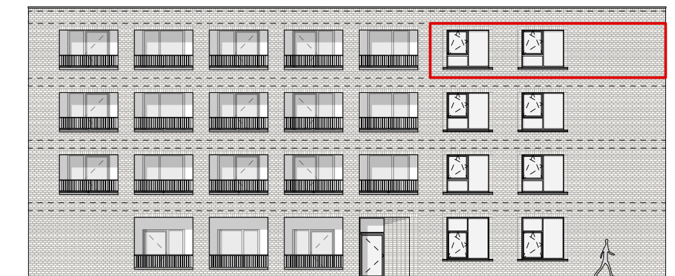
GEVEL - ZUID