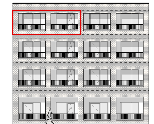
GEVEL - OOST