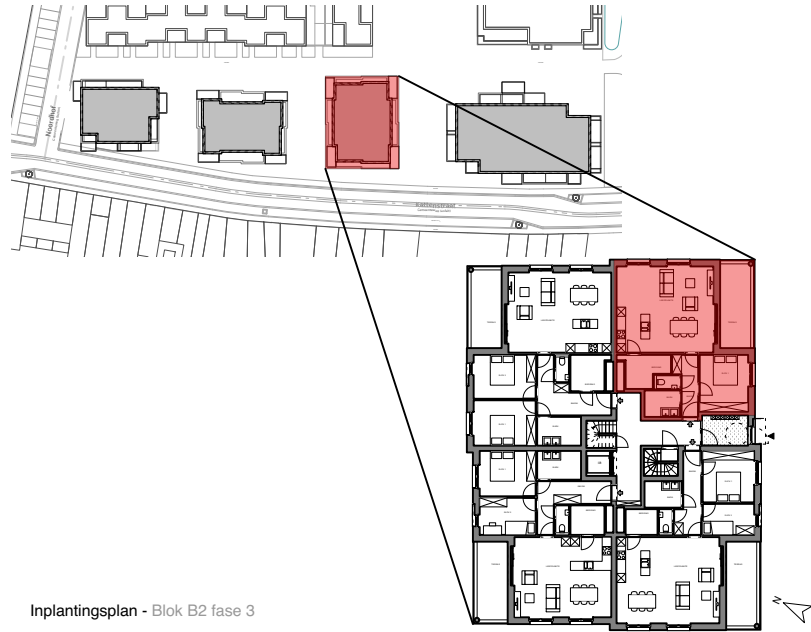
Inplantingsplan - Blok B2 fase 3