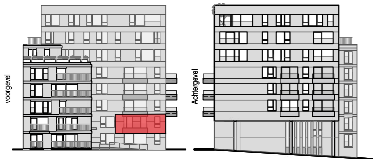
gevelaanzicht Sea Breeze