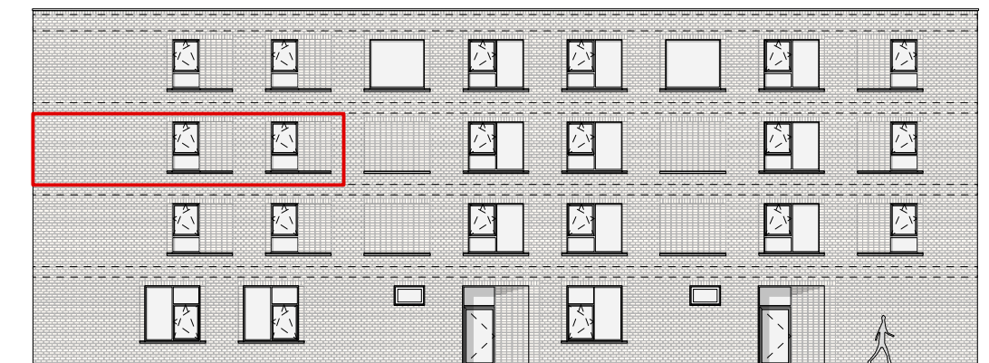
GEVEL - NOORD