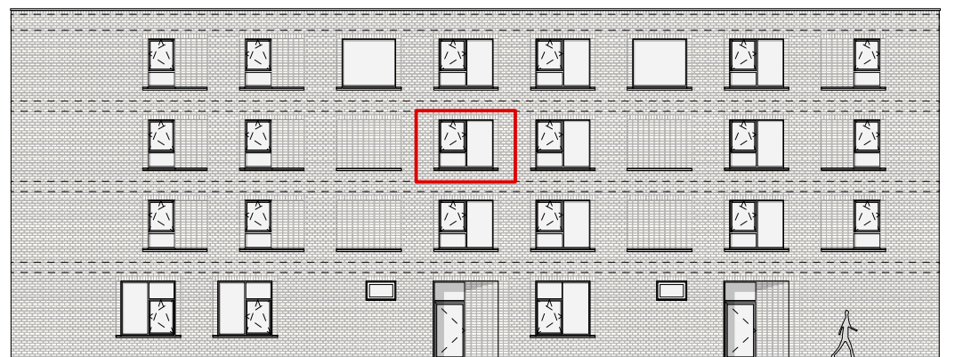
GEVEL - NOORD