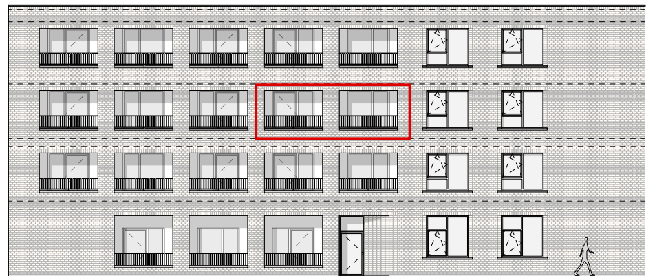
GEVEL - ZUID