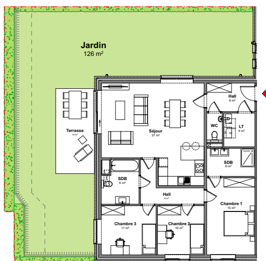
Vue en plan