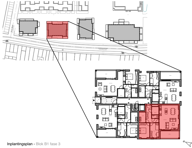
Inplantingsplan - Blok B1 fase 3