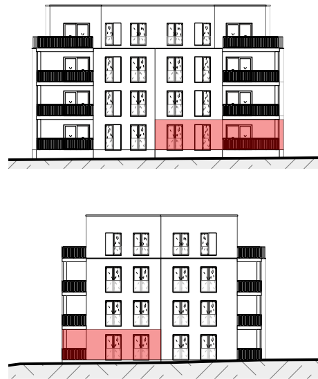
Gevelaanzicht - Blok B1 fase 3