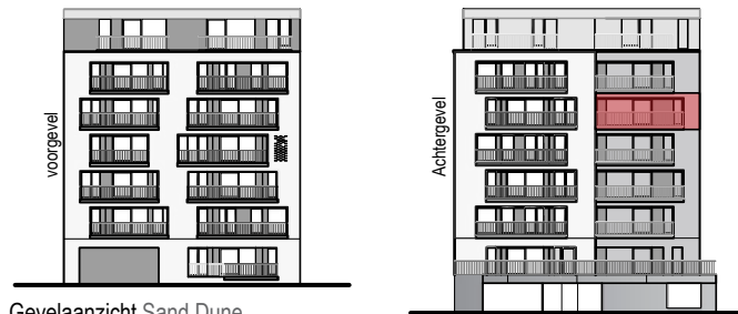
Gevelaanzicht Sand Dune