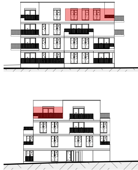
Gevelaanzicht - Blok A fase 3