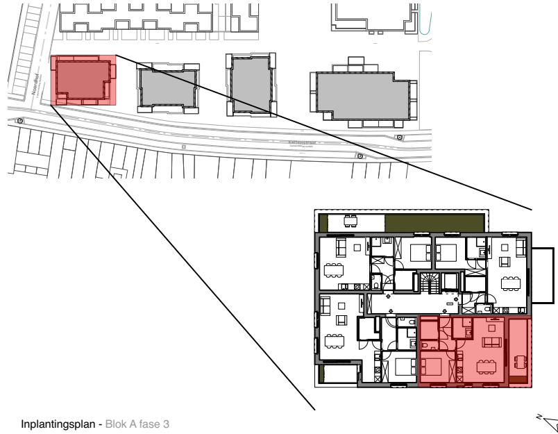
Inplantingsplan - Blok A fase 3