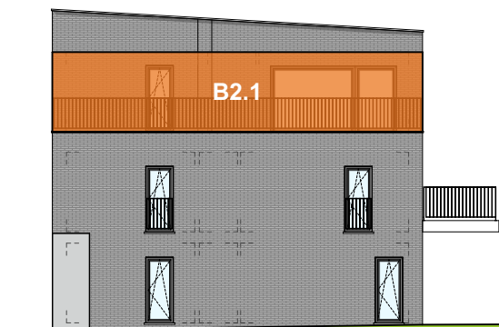
Façade laterale droite