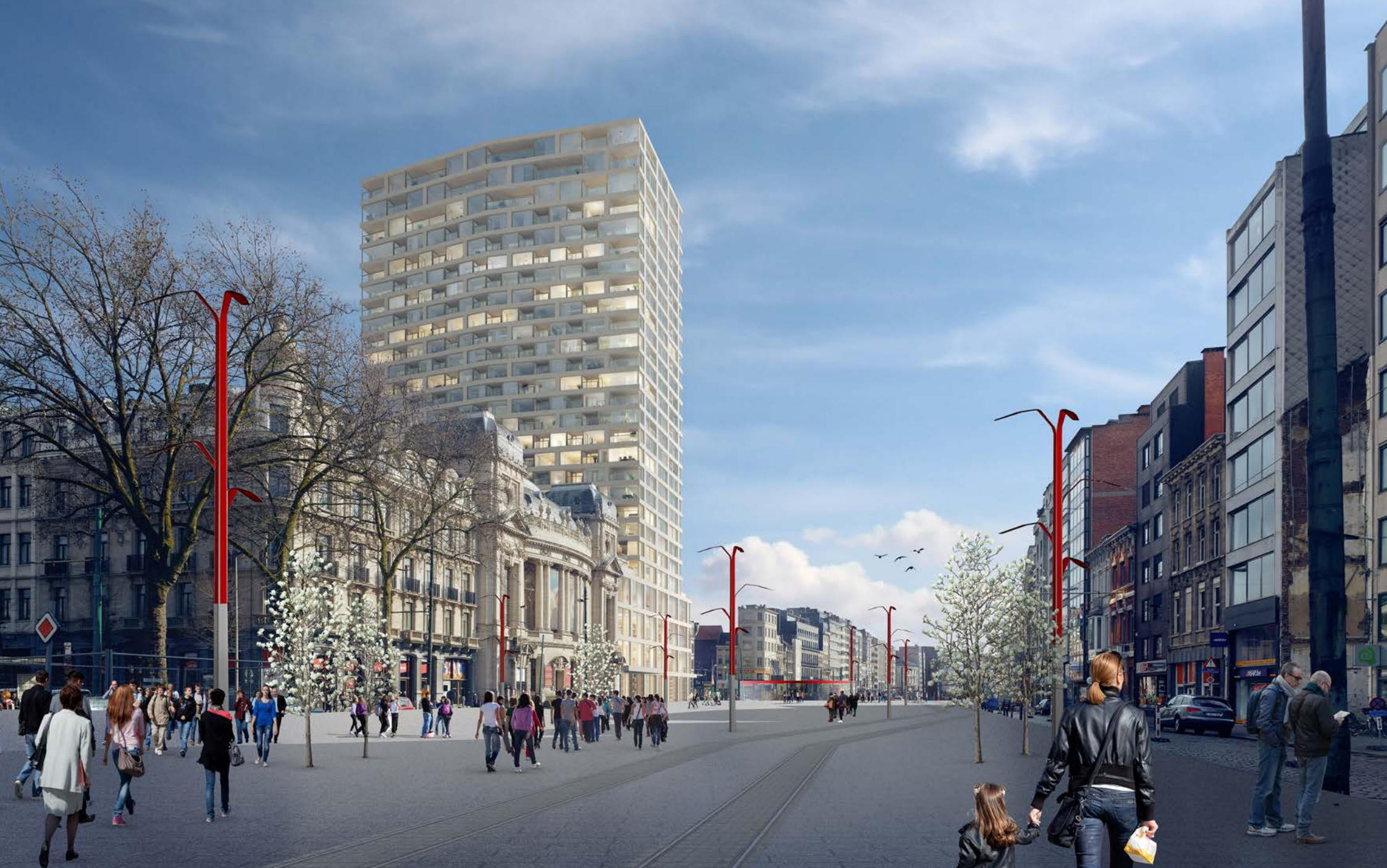
ANTWERPEN ANTWERP TOWER