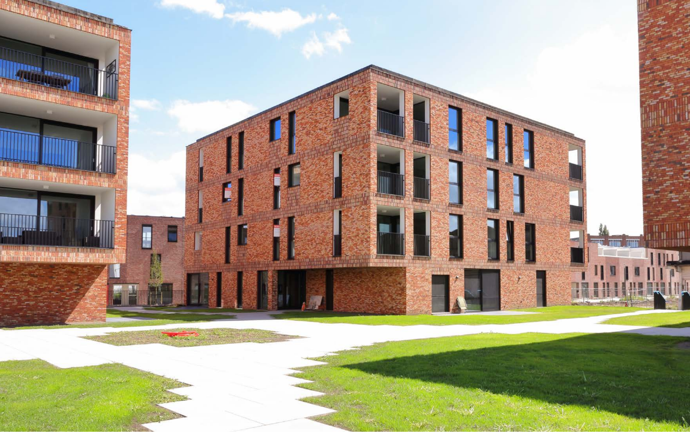
AALST PIER KORNEL