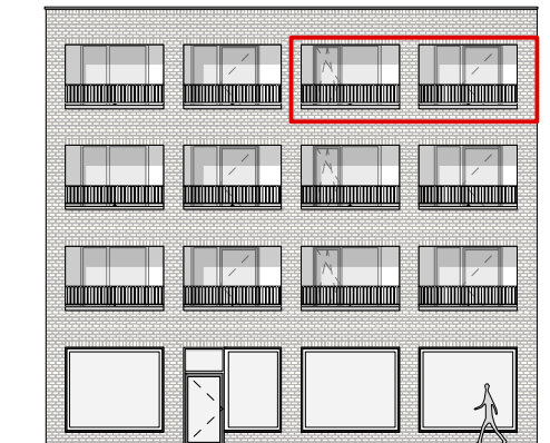
GEVEL - WEST