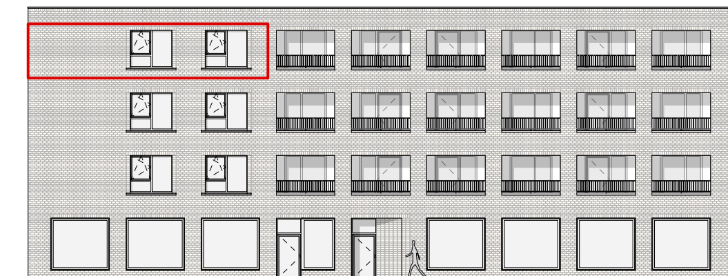
GEVEL - ZUID